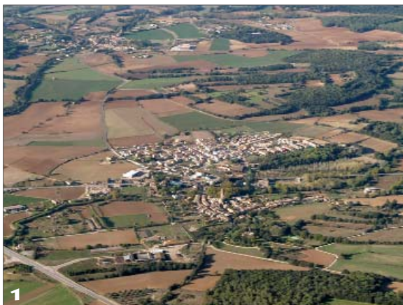
Vista aèria de Corçà i del territori que quedaria afectat per la variant sud.

La variant arribaria a l'alçada del Rissec i vorejaria el bosc de Can Fuertes pel