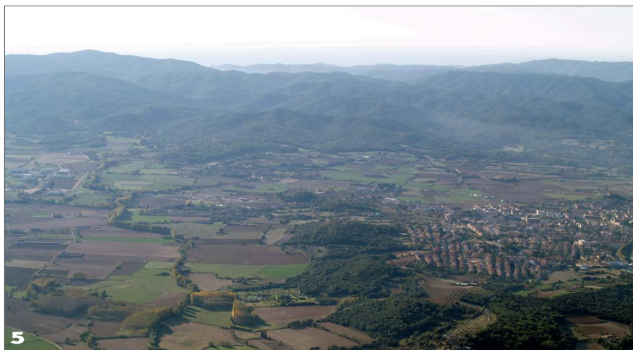
Vista aèria de les Gavarres.

Durant aquest temps, han anat apareixent plataformes opositores a banda i banda del controvertit eix viari –la Plataforma pel Nord , Salvem Santa Cristina i No a la variant nord – que, en la majoria de casos, sostenen arguments que poden ser utilitzats tant per uns com per altres. Aquestes entitats han fet muntatges de com quedaria cada opció, han organitzat sortides per veure el recorregut i han recollit adhesions en persona i a