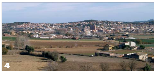
La variant travessaria pels camps entre la Bisbal i Cruïlles, on aniria un enllaç amb la GI-664.

L'anunci del conseller de Política Territorial i Obres Públiques, Joaquim Nadal, al diari El Punt el 4 d'agost passat va fer sonar totes les alarmes. I això que no era el primer cop que Nadal es posicionava a favor de l'opció sud; el 2002 com a Secretari d'Infraestructures del PSC, ja escrivia en aquest sentit. Nadal apuntava el 4 d'agost que un estudi tècnic substituïria l' Estudi d'impacte ambiental de 2006 demostrant que l'opció sud és millor que la nord, ja que aquest, segons deia, va quedar ràpidament desfasat. En un article d'opinió personal publicat a Diari de Girona el 2 de setembre, afirmava que aquest nou treball assenyalarà "la sud com a opció preferent" tot i que també matisava en el text que "el director general de Carreteres [Jordi Follia, natural de Sant Sadurní] és favorable a l'opció nord". El mateix Nadal havia dit un mes abans a El Punt que