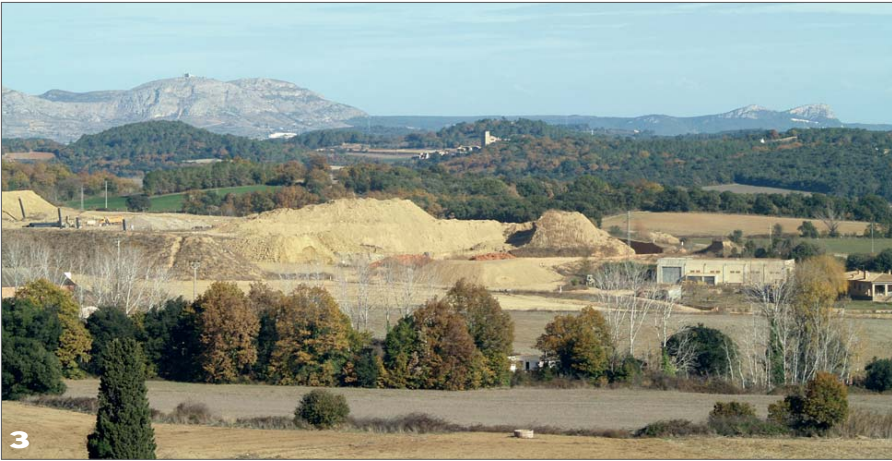
Les terres de Can Colomer. Al centre i al fons, Castell d'Empordà, lloc de pas de la variant nord.