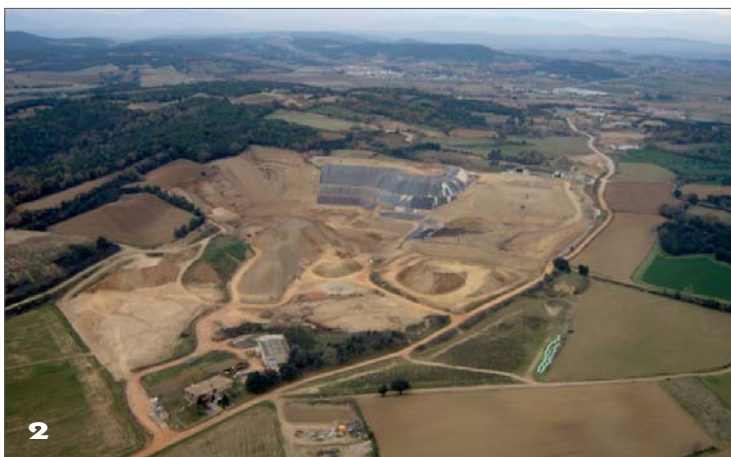
Vista aèria del paratge de Vacamorta.

En total, 10,5 quilòmetres (dels quals uns 2,5 quilòmetres en línia recta afectarien a Cruïlles), amb set passos superiors, tres passos inferiors, un viaducte, tres enllaços i el creuament de set rius i rieres. L'opció nord suposaria 8,6 quilòmetres, vuit passos elevats, quatre d'inferiors, un pont, dos túnels d'una única direccionalitat a Castell d'Empordà, dos enllaços i creuaria cinc rius i rieres.